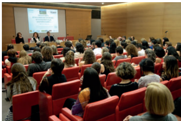
Au Palais du Luxembourg en 2011 : Clôture de la XXX e Université d'Été